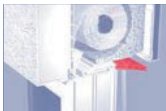
Revision nach unten mit Putzanschlag